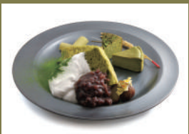
โทคุเซมัจจะ จุนมัย เฟลท 1200เยน