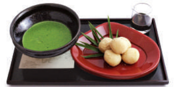
ชิระโมจิ โตะ โอะมัจฉะ โนะ เซต