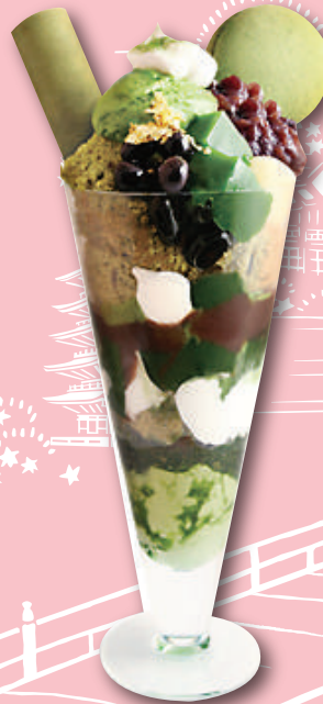
พาเฟต์ชาเขียวมัทฉะ ที่คัดสรรมาเป็นพิเศษของ Nishio 1200เยน