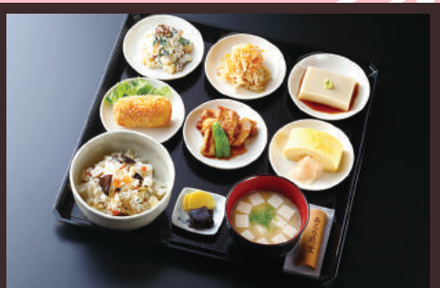
ยาชีฮาชิโนะชาใต้เซน 1800เยน