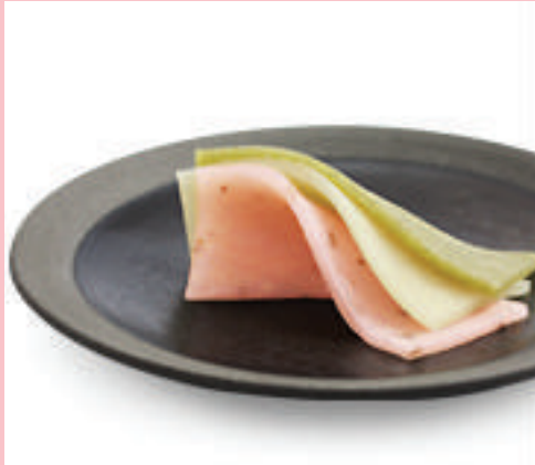
Nama Yatsuhashi 250เยน~/185กรัม