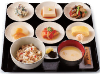
ยาซีฮาชิโนะซาโต้เซน