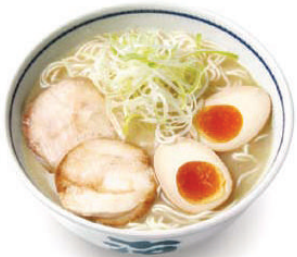
ราเมงแบบเกียวโต