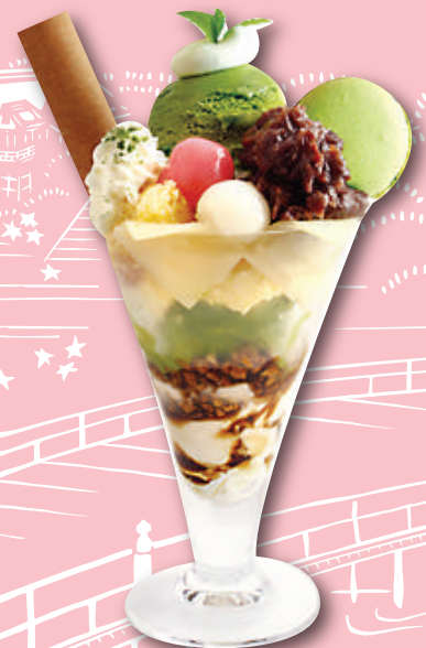
พาเฟต์ Nishio Yatsuhashi 1000เยน