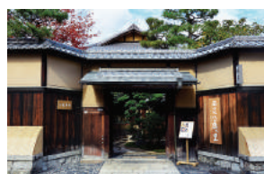
⑬Nishio Yatsuhashi no Sato