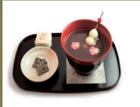
นิชิโอะ โนะ โอะชิรุโกะ 650เยน