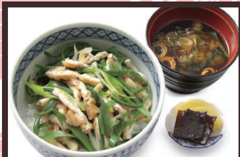
คิชิเนะดัง 800เยน