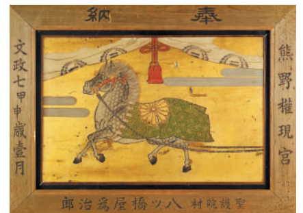
แผ่นเอมะ (แผ่นไม้รูปม้า) ที่ถูกถวายให้ศาลเจ้าคามาโนะในปีบุนเซที่ 7

นอกจากนี้ด้วยการพัฒนาให้แตกหักยากขึ้นในฐานะอาหารแบบพกพา Yatsuhashi จึงเปลี่ยนเป็นรูปร่างที่โค้งมนด้วยรูปร่างที่งดงามแบบนี้จึงทำให้เป็นตัวแทนของขนมชื่อดังจากเมืองเกียวโต