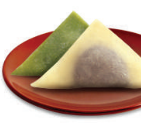
Annama (อันนามะ) 了都大 250เยน~/5อัน