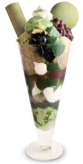
พาเฟ็ตซ่าเขียว