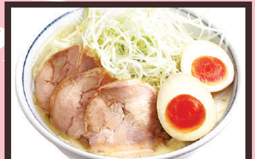
ราเมงแบบเกียวโต 980เยน