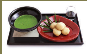
ชิระโมจิ โตะ โอะมัจจะ โนะ เซต 1000เยน