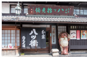
①Nishio Yatsuhashi Honten