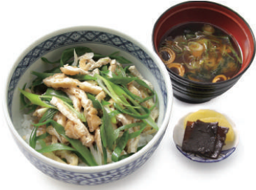
คิซีโหนดัง