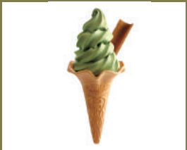
เกี๋ยวมัจจะ โชฟูโตะ 400เยน