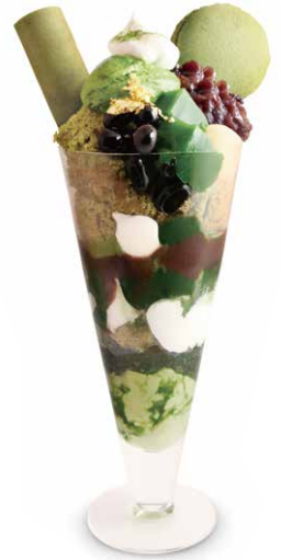
西尾特選抹茶聖代