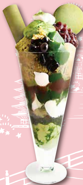
西尾特選抹茶聖代 1,200日圓