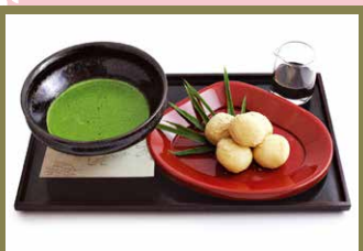
白餅抹茶套餐 1,000日圓