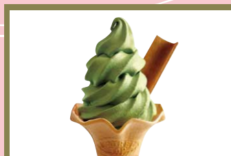
「京抹茶」霜淇淋 400日圓