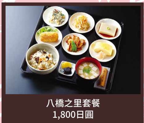
八橋之里套餐 1,800日圓