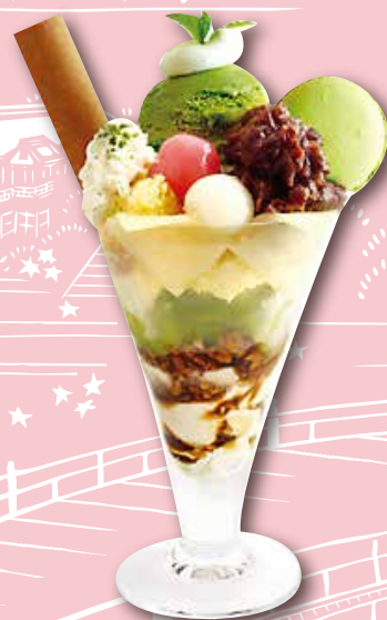
西尾八橋聖代 1,000日圓