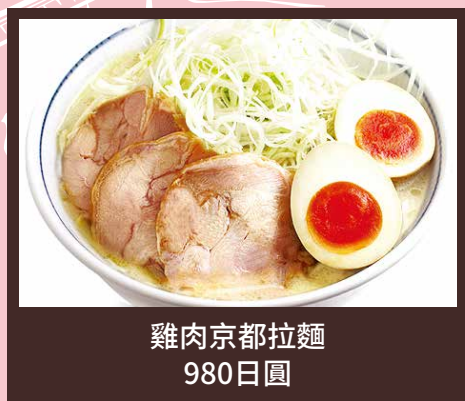
雞肉京都拉麵 980日圓